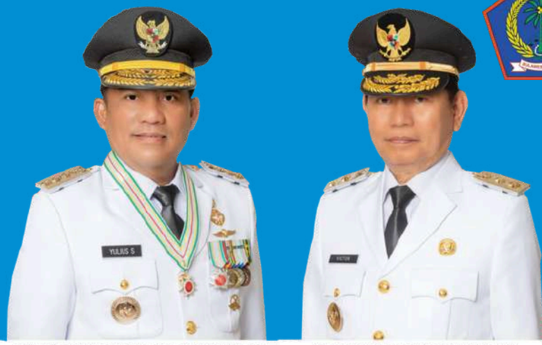
MAYJEN TNI (PURN) YULIUS SELWANUS, SE GUBERNUR SULAWESI UTARA